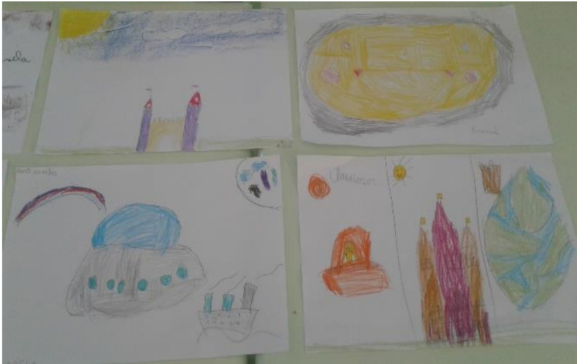
Figura 5: Produções das crianças, representando a música aquarela