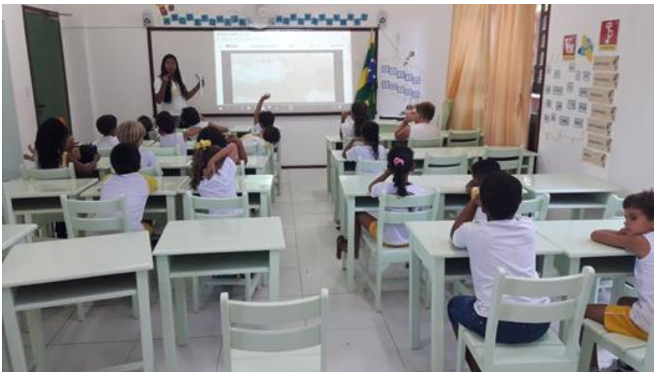
Figura 1: roda de conversa

pelos seus pais ou por outro membro da família fazendo parte do seu cotidiano. Foi essencial esse momento pois, pude conhecer os gostos musicais e ritmos preferidos de cada uma das crianças e também outras informações. “A integração entre os aspectos sensíveis, afetivos, estéticos e cognitivos, assim como a promoção de interação e comunicação social, conferem caráter significativo à linguagem musical.(RCNE,1998,V.III, p.45).”