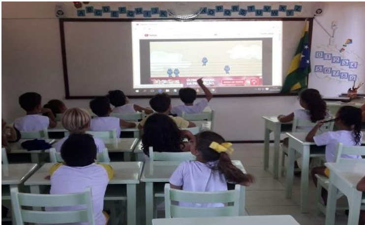
Figura 2: vídeo da música aquarela

No segundo momento foi colocado um vídeo com a música “aquarela”. Onde o objetivo foi fazer com que as crianças, pudessem cantar e ao mesmo tempo visualizar e identificar as imagens que a música estava citando e mostrando durante o vídeo.