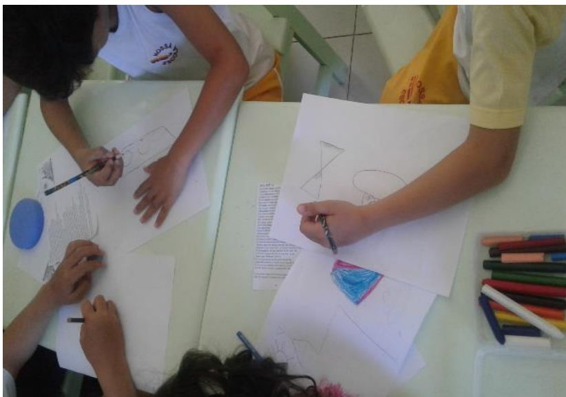
Figura 4: momento das crianças ilustrando a musica

[...], mas a música, em sala de aula, pode ir além de apenas um instrumento: ela é capaz de promover o desenvolvimento dos ser humano, torná-lo capaz de conhecer os elementos do seu mundo para nele intervir, transformando-o no sentido de ampliara comunicação, a colaboração e a liberdade entre os seres. (LOUREIRO, 2003)