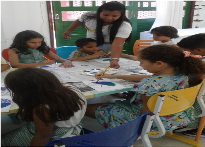
Figura 7: momento da explicação da atividade