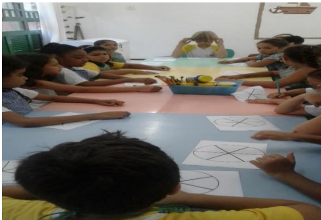
Figura 8: momento da pintura dos espectro.

As figuras foram distribuídas e as crianças puderam realizar as atividades.